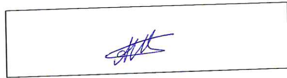
Место для подписи

Примечание: подпись должна иметь четкие, хорошо различимые линии, ставиться черными чернилами, занимать 80% выделенной области и не выходить за пределы рамки.