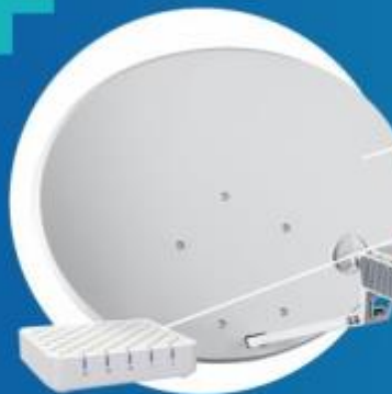
Комплект спутникового оборудования: